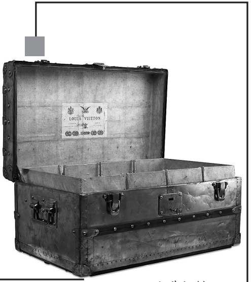
1888年黄铜制 EX-PLORER TRUNK 行李箱

路易威登从1850年代起开创奢华行李箱,现已成为时装界传奇品牌。本次拍卖,藏家有机会购藏1888年使用黄铜制作 Explorer Trunk 行李箱以及近年与街头潮牌 Supreme 合作推出的限量真皮行李箱。